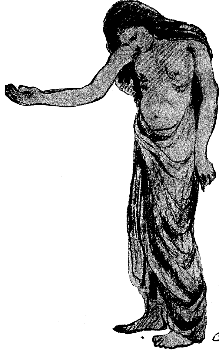
لمن ان خليل جبران

في مثل تلك الساعة كان شبح يسير بين اشجار التوت المحيطة بدار غنية ذات ثلاث طبقات منفردة على طرف القرية ، جدرانها بيضاء وسطحها